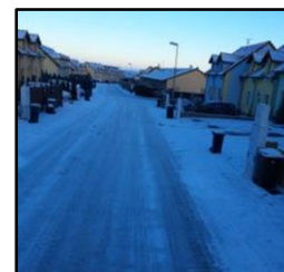
příklady nesjízdných komunikací